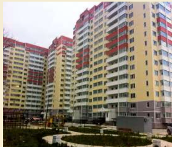
Прийняте в експлуатацію нове житло від забудовника (на первинному ринку)