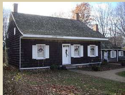
Будинок (із земельною ділянкою)*

*Якщо Ви купите приватний будинок, компенсація може надаватись і на придбання земельної ділянки, на якій розміщується будинок