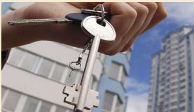
Перебуває у власності інших осіб (на вторинному ринку)